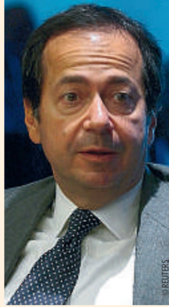
Hedgefundmanager John Paulson.

Dankzij de schikking ontsnapt Goldman alvast aan een aanslepende publieke rechtzaak met de SEC, wat de reputatieschade voor de bank mogelijk nog groter zou gemaakt hebben. Aandeelhouders zetten Goldman de voorbije weken onder druk om snel tot een schikking te komen en zo een eventuele